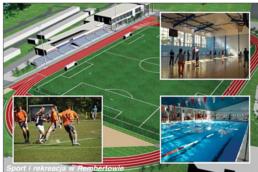
Sport i rekreacja w Rembertowie

W czasie mijającej kadencji samorządowej aż czterokrotnie wzrósł budżet Domów Kultury. W 2002 roku wynosił on pół mln zł, a w 2007 r. (co już zostało zatwierdzone) będzie to kwota przeszło 2,2 mln zł! Jednak dwa prężnie działające domy kultury „Wygoda” i „Rembertów” to za mało dla powiększającej się,