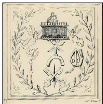
Prastary herb Pragi.

szego elementu czysto polskiego, nie brak było cudzoziemców: Niemców, Włochów, Holendrów, Szkotów, Francuzów, Greków i Ormian, a nawet Tatarów. Nic dziwnego, że ta ludność, przybyła do Warszawy z chęci zysku, nie reagowała na rozgrywane się w niej wydarzenia polityczne, nawet jeśli dotyczyły bezpośredniego zagrożenia jej mienia i życia. Podobnie zachowywała się ludność polska, równie obojętna na sprawy publiczne, pochłonięta walką o byt, zwłaszcza wobec coraz ostrzejszej konkurencji rozwi-