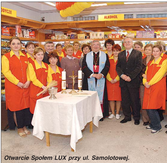
Otwarcie Spółem LUX przy ul. Samolotowej.

Tegoroczna mroźna zima mogła spowodować zmarznięcie wielu drzew. Czy zmarzły naprawdę? O tym przekonać się będzie można porównując je z innymi drzewami tego samego gatunku. Jeśli w innych ogrodach kwitną, a u nas nie, wówczas można podejrzewać, że drzewo zmarzło. Pewności nabierzemy, gdy zmienia kolor na brązowy i wygląda jakby było zgniłe. Co wtedy? Trzeba je wyciąć. Niestety zgodnie z przepisami, jeśli teren objęty jest ochroną konserwatorską wówczas samodzielnie i bez zgody konserwatora można wyciąć jedynie drzewa owocowe i to nie starsze niż pięcioletnie. Na terenach nie objętych opieką konserwatora wycinać można jedynie