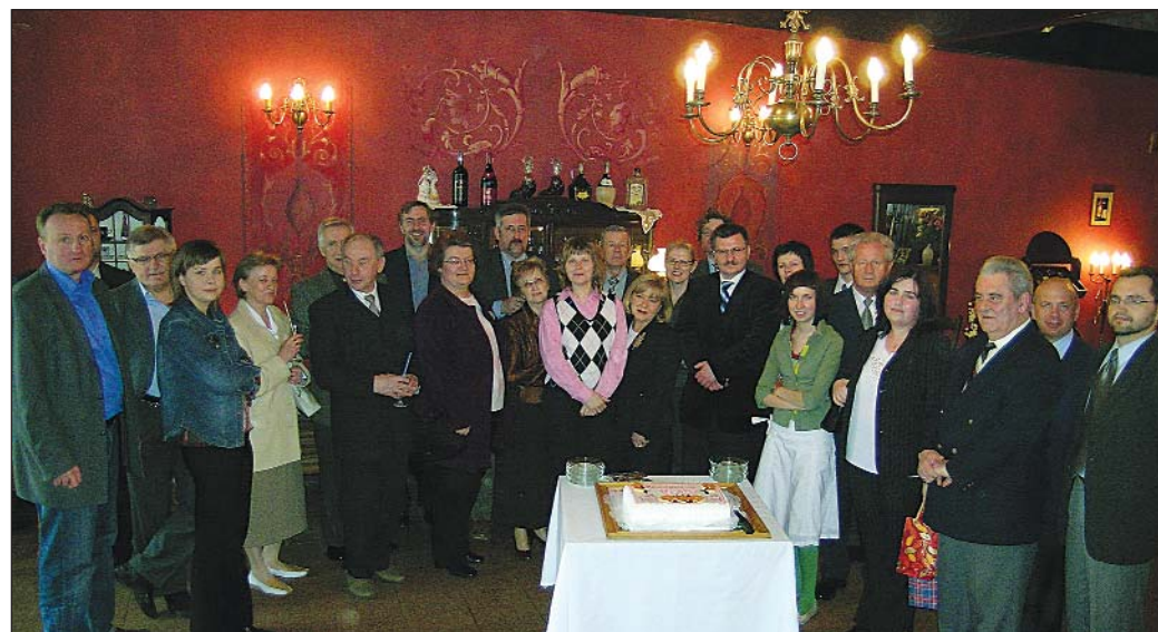
Dopiero po świętach udało się zebrać (prawie w komplecie) zespół redakcyjny i współpracowników. Figaro 20 kwietnia 2006 r.