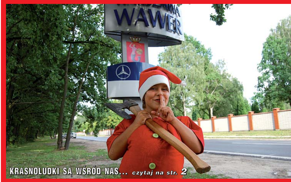
KRASNOLUDKI SĄ WŚRÓD NAS... czytaj na str. 2