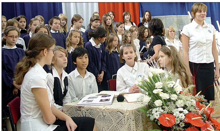
Uczniowie z koła teatralnego i chóru przygotowali wzruszające widowisko.