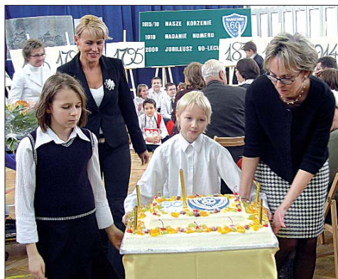
Na urodzinowych gości czekał wspaniały tort.

W obecnej siedzibie, przy ul. Zbaraskiej, szkoła mieści się od 1965 r. Podobnie jak bliźniaczy budynek Liceum Ogólnokształcącego nr XIX im. Powstańców Warszawy, nowa sześćdziesiąt-