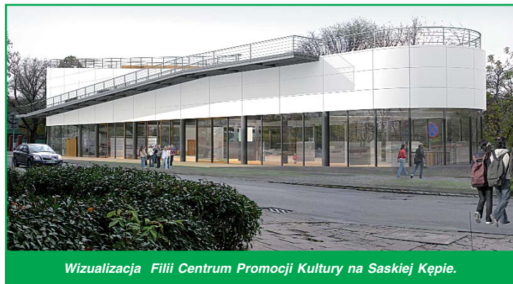
Wizualizacja Filii Centrum Promocji Kultury na Saskiej Kępie.

- To prawda, że wizerunek prawobrzeżnej Warszawy nie był dobry i ciągle jeszcze nie jest dobry. Chociaż ciężko na nim wiele nieprawdziwych i krzywdzących stereotypów. Stan budynków komunalnych jest zły. Nieremontowane od 1945 roku wymagają dużych nakładów finansowych. Oszacowane potrzeby opiewają na kwotę aż 120 mln zł, z czego prawie połowa powinna zostać uruchomiona w trybie pilnym ze względu na rodzaj i charakter niezbędnych remontów. Zmieniamy koncepcje podejścia do remontów z częściowych, o charakterze doraźnym na kompleksowe. Nad poprawą estetyki budynków pracują też wspólnoty mieszkaniowe, które bardzo dobrze zarządzają nieruchomościami. Przykładem tych działań są wyremontowane elewacje kamienic, których liczba systematycznie wzrasta. Idąc w kierunku zmiany wizerunku Dzielnicy rozpoczynamy realizację programu „Kolorowa Praga”, którego głównym założeniem jest przekształcenie głównych arterii komunikacyjnych, czyli ulicy Grochowskiej i Alei Waszyngtona w wizytówki Naszej Dzielnicy. Do pilotażu tego programu wy-