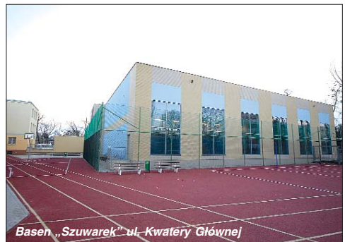
Basen „Szuwarek” ul. Kwatery Głównej