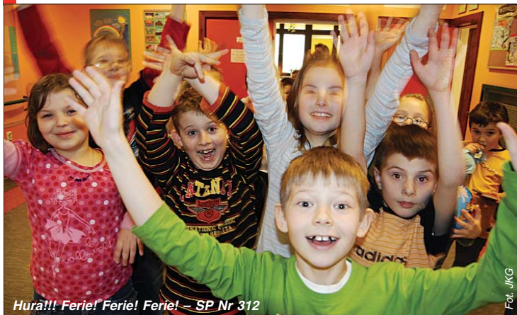
Huraj!!! Ferie! Ferie! Ferie! – SP Nr 312

Można wybrać pobliską szkołę lub klub osiedlowy. W akcję „Zima w mieście” włączyły się również biblioteki, z programem wycieczkowo – konkursowym oraz niektóre licea, stawiające na