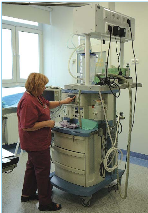
Najwyższej jakości sprzęt umożliwił wszechstronne badania

CENTRUM MEDYCZNE „OSTROBRAMSKA” NZOZ „MAGODENT”