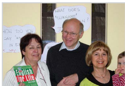
Fabryka Uśmiechów – Centrum Edukacji Dziecięcej; ul. Chłopskiego 17/19; czynne: poniedziałek – piątek 10 00 –18 00 ; Tel. 0-22 405-41-99.

Uwaga! Z tym egzemplarzem „Mieszkańca” dla uczestników zajęć kawa, herbata i podręczniki, każdy wartościoko 50 zł, gratis!