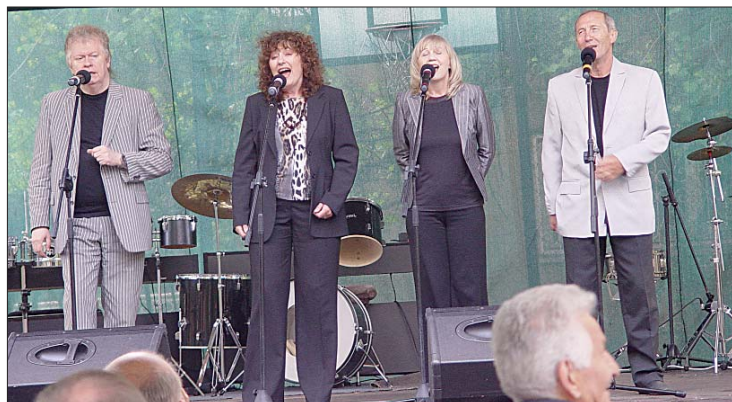
Zespół PARTITA zaprezentował wiązankę evergreenów.

w stanie wojennym, trudno było wtedy cokolwiek zdobyć. Ktoś dał jakieś materiały, kto inny przywiózł robotników i wspólnymi siłami udało się budynek postawić. Dziś korzystają z niego jeszcze osoby, które pomagały przy budowie – opowiada instruktorka muzyki.