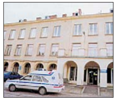
Zamknięto poradnię nefrologiczną Szpitala Dziecięcego przy Niekańskiej. Lekarze nie spełniali nowych wymogów Narodowego Funduszu Zdrowia.