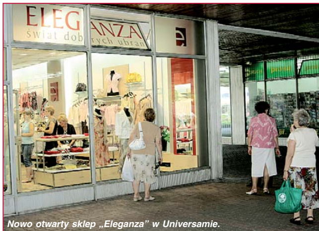
Nowo otwarty sklep „Eleganza” w Uniwersamie.

Ciekawa jest sama historia Eleganzę. Sieć sklepów powstała na bazie porozumienia 13 domów handlowych z największych miast Polski. Oznacza to, że po pierwsze polscy spółdzielcy połączyli siły, by skutecznie konkurować z za-