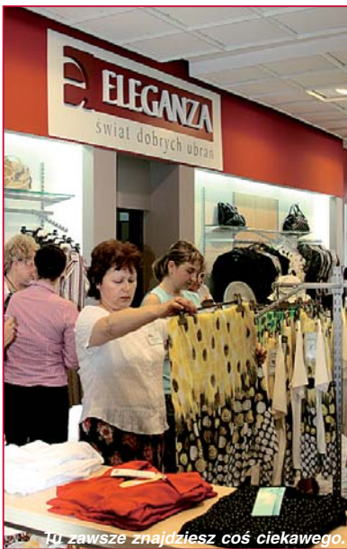
Tu zawsze znajdziesz coś ciekawego.

chodnimi firmami i wielkimi centrami handlowymi. Po drugie, w salonach Eleganzę znajdziemy jedynie kolekcje polskich projektantów. Sklep chce wyróżnić się na rynku tym, że promuje rodzime marki takie jak: Moda Wrocław, Halszka, Getex, Białcon czy Warmia. – Panuje bardzo krzywdzący stereotyp, o tym, że producenci odzieży z zachodu robią ubrania o lepszej jakości. To nieprawda! Nasze kolekcje wybieramy spośród najlepszych polskich wytwórców. Osoby dokonujące selekcji dwa razy w roku uczestniczą w Trendach Mody, by zaspokoić gusta naszych klientek – mówi kierowniczka Salonu Eleganzę w Uniwersamie.