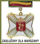
ZASŁUŻONY DLA WARSZAWY