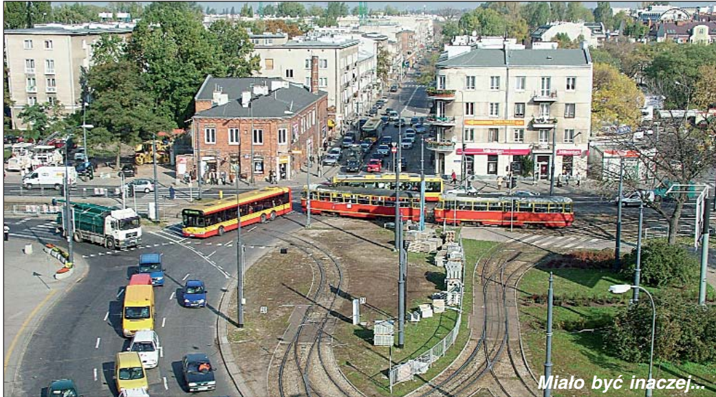
Miało być inaczej...