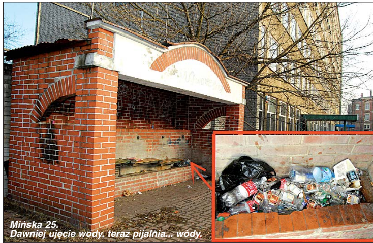
Mińska 25. Dawniej ujęcie wody, teraz pijalnia... wody.