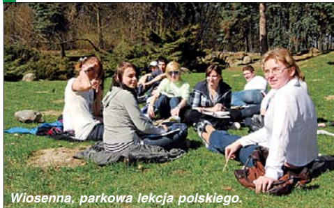
Wiosenna, parkowa lekcja polskiego.