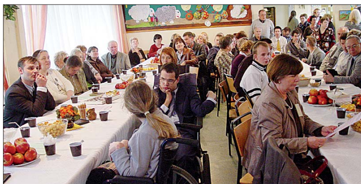
Na sobotnie spotkanie przybyli podopieczni i absolwenci z rodzicami.