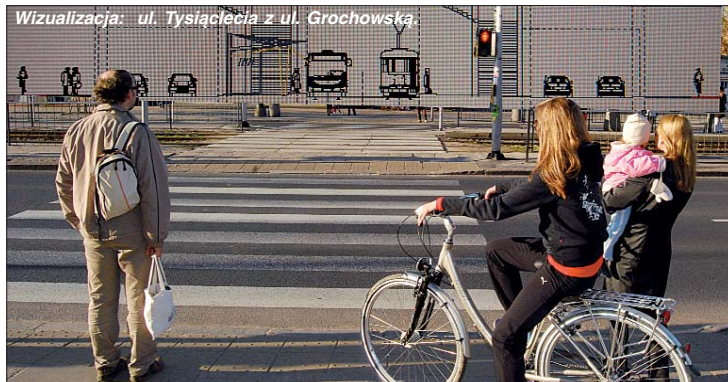
Wizualizacja: ul. Tysiąclecia z ul. Grochowska