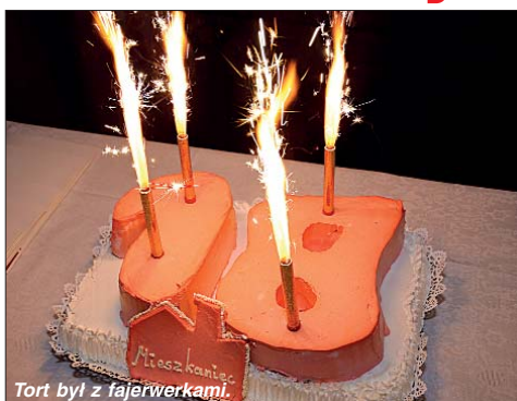
Tort był z fajerwerkami.

Ale otrzymałem ją w wieku „nieprawidłowym”, bo nie w osiemnastolecie, ale w dwiętnastolecie mojego życia. Błąd ten został naprawiony dopiero w 65 lat później, a dokładnie 7 kwietnia 2009 roku, kiedy na wielkanocnym przyjęciu w „Figaro Park” w Parku Skaryszewskim z okazji osiemnastolecia Mieszkańca, otrzymałem, jak 17 innych osób, „Cer-