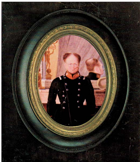
W. ks. Konstanty. Karta pocztowa ze zbiorów autora (1910).

1831). Niestety, zamach na rosyjskiego satrapę się nie powiódł. Wielki Książę w przebraniu niewieścim, jak głosi przekaz, w towarzystwie żony – Polki, Joanny Grudzińskiej (1791-1831), noszącej tytuł Księżnej Łowickiej i niewielkiej eskorty oddanych sobie żołnierzy wymknął się zamachowcom. Przemknąłszy w zamkniętym pudle karety przez podwarszawski wówczas Mokotów dotarł do karczmy w Wierzbnie (dziś część Mokotowa), gdzie z uwagi na rozwijającą się chorobę małżonki zatrzymał się na noc i czekał na dalszy bieg wypadków. W tym czasie powstanie objęło już całą Warszawę. Z pomocą uzbrojonej własnym sumptem ludności stolicy zdobyty został Arsenał, pod którym zaraz zaczęły toczyć się walki rozprzestrzeniające się na inne rejony miasta m.in. ulice: Długa, Miodowa, Krakowskie Przedmieście, Bielańska, Tłomackie, Leszno aż po Wolę i Powązki. Otworzyły się wszystkie koszar, w których stacjonowali polscy żołnierze, a do nich spontanicznie przyłączyli się coraz potężniejsze