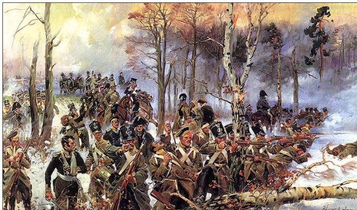
Bitwa pod Olszynką Grochowską. Karta pocztowa (ok. 1925).

cy na komendę w Parku Łazienkowskim na mostku w Agrykoli. Powstanie rozpoczął atak na Belweder, ówczesną siedzibę carskiego brata w. ks. Konstantego (1779-