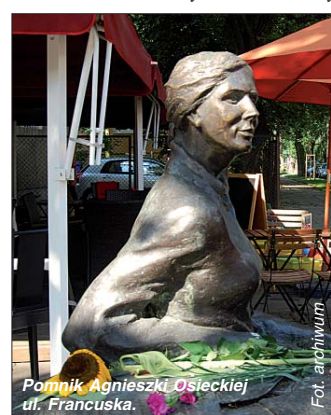
Pomnik Agnieszki Osieckiej ul. Francuska.

Z uwagi na „wartość artystyczną i zabytkową” zabudowa fragmentu Saskiej Kępy ograniczona: od wschodu ulicami Saską, Zwycięzców oraz Brukselską, od południowego wschodu ul. Ateńskiej, od zachodu ul. Wał Miedzeszyński, od północy aleją Poniatowskiego i aleją Waszyngtona, decyzją z dnia 02.04.1979 roku została wpisana do rejestru zabytków Miasta Stołecznego Warszawy. W uzasadnieniu ówczesny Konserwator Zabytków m.st. Warszawy