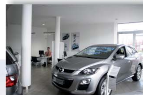
Od ponad roku warszawski dealer Nivette ma autoryzację na sprzedaż i serwis samochodów marki Mazda. Salon mieści się przy ul. Lotniczej 3/5 (okolice węzła Marsa i Ostrobramskiej).