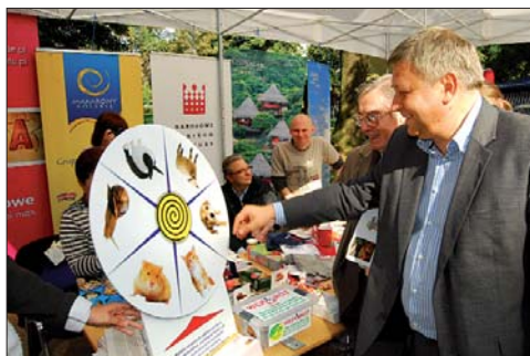
Samorządowcy przy loterii.

Najważniejsze jednak, że piknik się udał, pogoda dopisała, mieszkańcy przyszli licznie, a organizacje pozarządowe przedstawiły swój dorobek i swoje oferty. ar