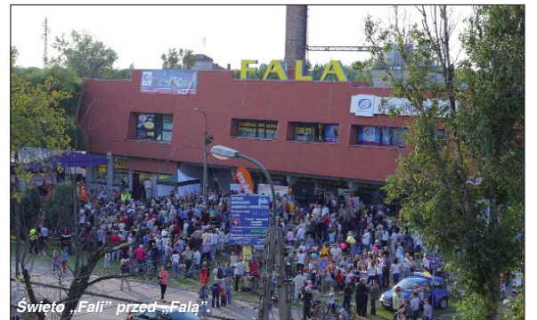
Święto „Fali” przed „Falą”.