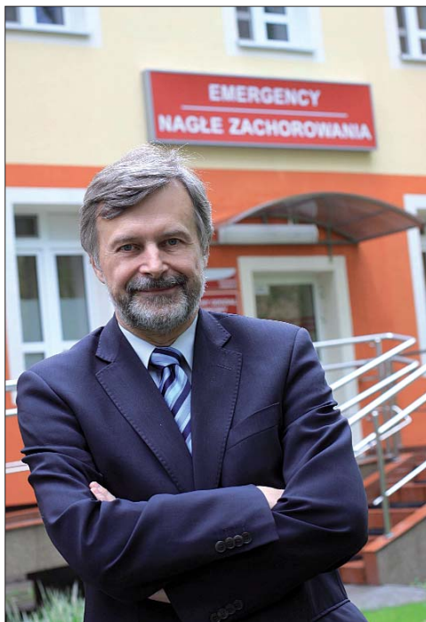
Marek Balicki – lekarz, polityk, dyrektor Szpitala Wolskiego w Warszawie, doświadczony parlamentarzysta, były minister zdrowia.

- Największe problemy z jakimi borykają się młodzi ludzie, wkraczający na rynek pracy, to powszechny dziś zwyczaj