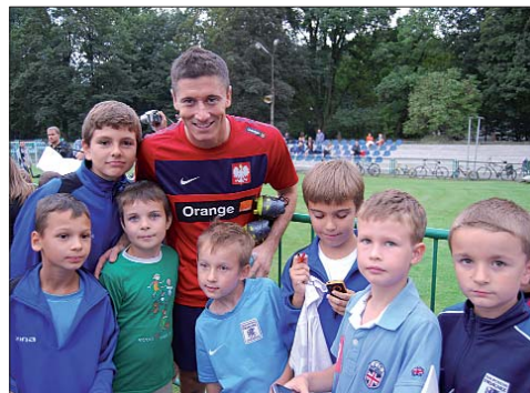
„Lewy” z następcami z „Drukarza”.

- W drodze na „Drukarza” przejeżdżaliście drużyną obok Stadionu Narodowego – jakie komentarze dominowały w autokarze?