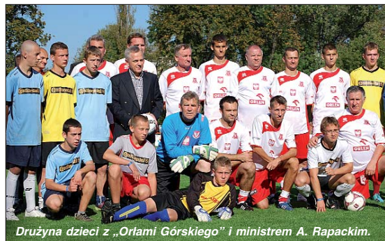
Drużyna dzieci z „Orłami Górskiego” i ministrem A. Rapackim.