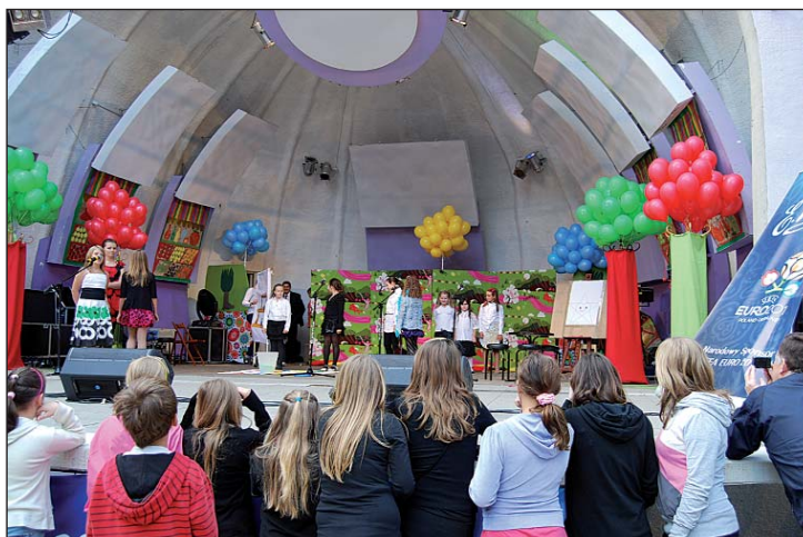
Dzieci rządziły w Muszli.

Nie brakowało interaktywnych atrakcji. Na przykład południowopraske ZHR uczył małe dzieci robienia olbrzymich baniek mydlanych. Zabawa cieszyła się olbrzymim powodzeniem. – Świetnie wam idzie! – harcerki chwaliły dzieci, które często robiły bańki większe od