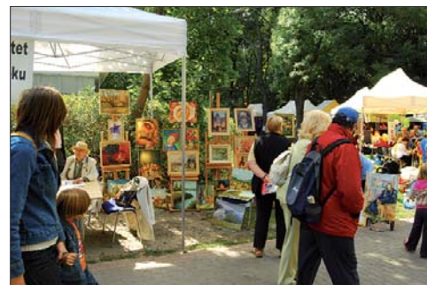
Galerie pod chmurką.