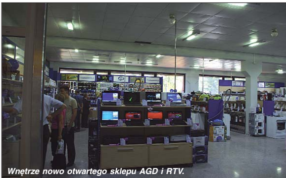
Wnętrze nowego otwartego sklepu AGD i RTV.