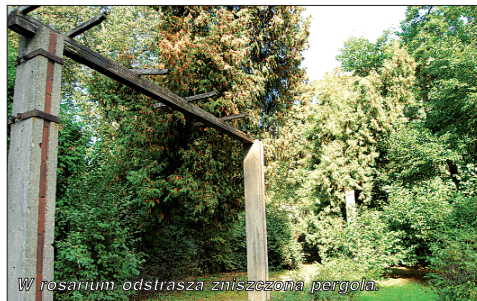
W rosarium odstrasza zniszczoną pergolę

- Moimi ulubionymi zajęciami były wtedy jazdy po parkowych alejkach rowerkami i... elektrycznymi samochodzikami - wspomina „Mieszkańcowi”. W archiwach Michnikowskich zachowały się zdjęcia z tamtych czasów. Na fotografiach widać, jak efektywnie wyglądała wtedy różanka, czy ogród daliowy.