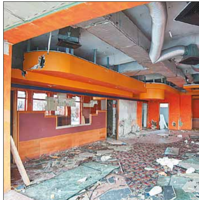
Do Euro pozostało już tylko kilkadziesiąt dni, a w niewielkiej odległości od Stadionu Narodowego przy al. Waszyngtona 98 wyrosła nam nie lada atrakcja turystyczna. Budynek po sieciowej pizzerii na razie cieszy i zachęca do zwiedzania tylko miejscowych amatorów mocnych i nocnych wrażeń...

Organizatorami konkursu są: Zarządy Dzielnicy Praga Południe i Wawra, „Społem” WSS Praga Południe, WSH „Fala” oraz nasza redakcja. Dla laureatów przewidziane są specjalne puchary i dyplomy, a dla Czytelników biorących udział w konkursie nagrody-upominki. (ab)