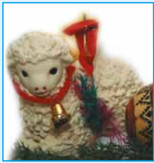
Pamiętajmy o tej wielkiej Nadziei dla nas wszystkich. Chrystus skruszywszy więzy

nia jest Jezus z Nazaretu. On też doświadczył cierpienia. I zmartwychwstał. „Trzy Maryje poszły, drogie matki niosły. Chciały Chrystusa pomazać, Jemu cześć i chwałę dać. Gdy na drodze były, tak sobie mówiły: jest tam kamień niemały, a któż go odwali, Gdy nad grobem stali, rzekł im Anioł biały: Nie bójcie się Maryje, Zmartwychwstał Pan i żyje”.