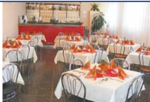
Szkolna Pracownia Obsługi Konsumenta

Najlepiej – taka, która wspiera uczniów w rozwijaniu ich pasji, dba o ich kontakty międzynarodowe, w której jeszcze w trakcie nauki możesz zarobić sobie całkiem niezłe kieszonkowe!