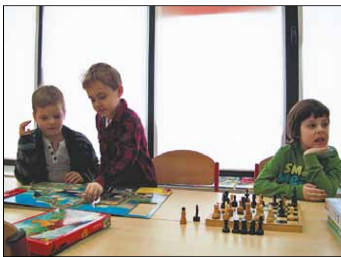
Wielbiciele gier planszowych z Saskiej Kępy.

a także wziąć udział w zajęciach plastycznych czy informacyjnych. Te ostatnie cieszą się jednak niewielkim powodzeniem.