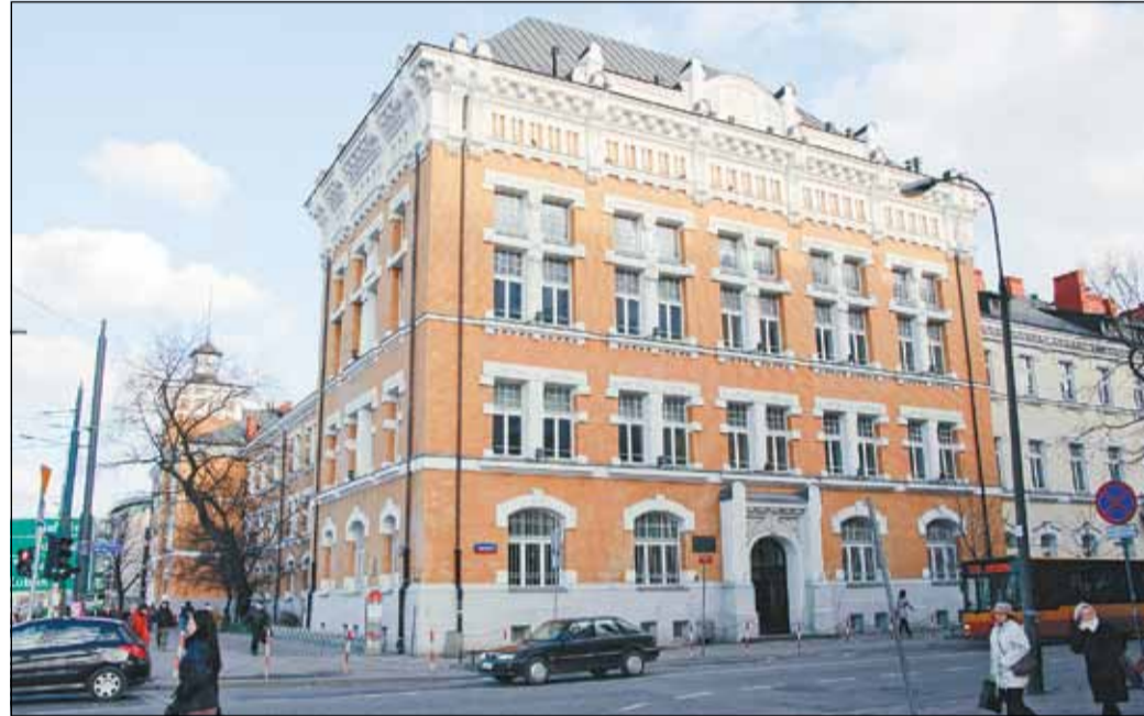
Zabytkowy budynek Liceum Ogólnokształcącego im. Władysława IV po renowacji.

ne. No i siłą rzeczy zmieni się klimat tych miejsc: na całym świecie tak jest, że w ślad za artystami, którzy jak pionierzy „przejmują” zapomniane kwartały miasta, tworząc tam miejsca sztuki i osiedlając się – podążają inni. Tak było w Paryżu, tak było w Nowym Jorku, nie