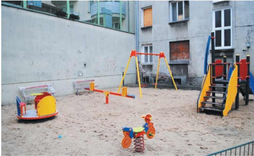
Zwycięskie projekty poprzedniego budżetu właśnie są realizowane. Jednak władze dzielnicy potrafią skorzystać z bazy wszystkich zgłoszonych projektów. Dobry przykład z Pragi-Południe – pomiędzy ul. Rybną i Wawerską tak właśnie powstał plac zabaw dla dzieci.

dniami ich przyjmowania. „Jeszcze w niedzielę po południu (15 lutego) zgłoszonych było tylko 290 projektów” – informuje Centrum Komunikacji Społecznej, które koordynuje proces stołecznego budżetu obywatelskiego. Dwa dni później sprecyzowanych pomysłów na co wydać ponad 51 milionów samorządowych złotych było już ponad 2300! Liczba robi wrażenie, ale to bardzo niewielki wzrost (poniżej 4%) w porównaniu do pierw-