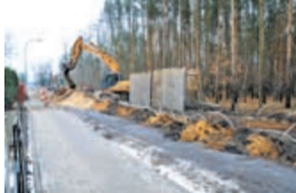
fol. Urząd Dzielnicy Rembertów

Trwa budowa nowej utwardzonej nawierzchni ul. Kadrowej na odcinku pomiędzy ulicami Czwartaków a Kramarską. Inwestycja została zaplanowana w porozumieniu z MPWiK. Oznacza to, że oprócz nawierzchni z betonowej kostki brukowej, równoległe wykonana zostanie kanalizacja wraz z przyłączami do granic