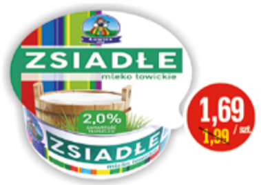
ZSIADŁE MLEKO ŁOWICKIE 400 G OSM ŁOWICZ (CENA ZA 1 KG - 4,23 ZŁ)