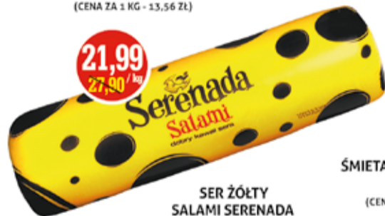
SER ŻÓŁTY SALAMI SERENADA