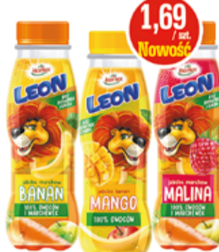
SOKI LEON 0,3 L JABŁKO-BANAN-MANGO, JABŁKO-MARCHEW-BANAN, JABŁKO-MARCHEW-MALINA HORTEX (CENA ZA 1 L - 5,63 ZŁ)