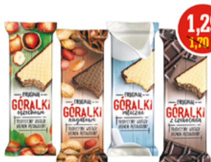
GÓRALKI 50 G ASORTYMENT (CENA ZA 1 KG - 25,80 ZŁ)