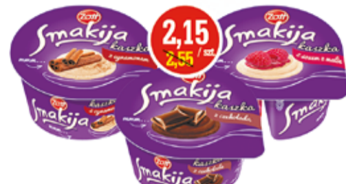
KASKA SMAKIJĄ 130 G ASORTYMENT ZOTT (CENA ZA 1 KG - 16,54 ZŁ)