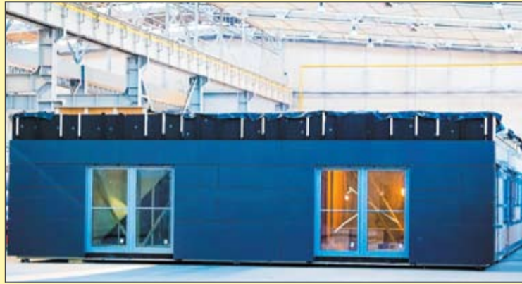
W Wawrze zostanie zastosowana nowoczesna technologia modułowa.