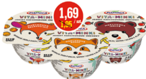
JOGURT VITA - MINKI 125 G ASORTYMENT PIĄTNICA (CENA ZA 1 KG - 13,52 ZŁ)