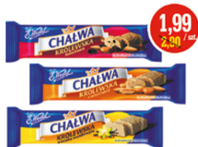
CHALWA 50 G ASORTYMENT WEDEL (CENA ZA 1 KG - 39,80 ZŁ)

Oferta ważna od 31 sierpnia do 13 września 2017 r. lub do wyczerpania zapasów