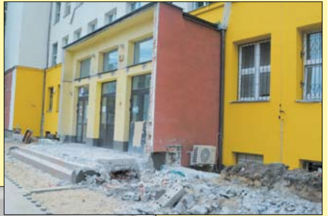
W przekształcanym w podstawówkę Gimnazjum nr 31 trwa remont.

Istotną kwestią, która interesuje zarówno dzieci, rodziców, jak i nauczycieli jest to, co stanie się z wygaszonymi gimnazjami, które docelowo mają być przekształcane w podsta-