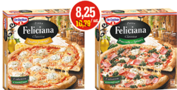
PIZZA FELICIANA 320-360 G WYBRANE SMAKI DR. OETKER (CENA ZA 1 KG - 22,92-25,79 ZŁ)