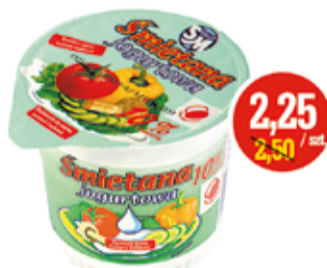
ŚMIETANA JOGURTOWA 10% 350 G OSM SIEDLCE (CENA ZA 1 KG - 6,43 ZŁ)