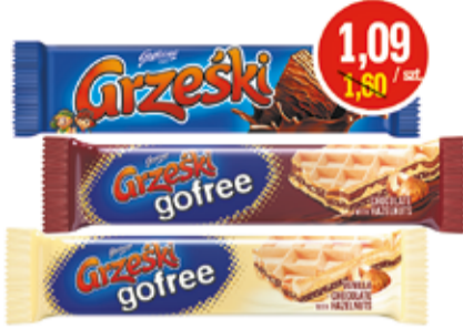
GRZEŚKI KAKAOWE W CZEKOLADZIE 36 G, GRZEŚKI GOFREE 33 G (CENA ZA 1 KG - 30,28/33,03 ZŁ)