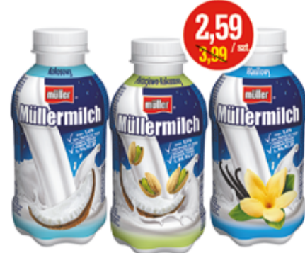
NAPÓJ MLECZNY MÜLLER MILCH 400 ML ASORTYMENT (CENA ZA 1 L - 6,48 ZŁ)