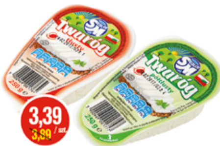
TWARÓG PÓŁTŁUSTY, TŁUSTY 250 G OSM SIEDLCE (CENA ZA 1 KG - 13,56 ZŁ)