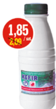
KEFIR 400 G OSM SIEDLCE (CENA ZA 1 KG - 4,63 ZŁ)