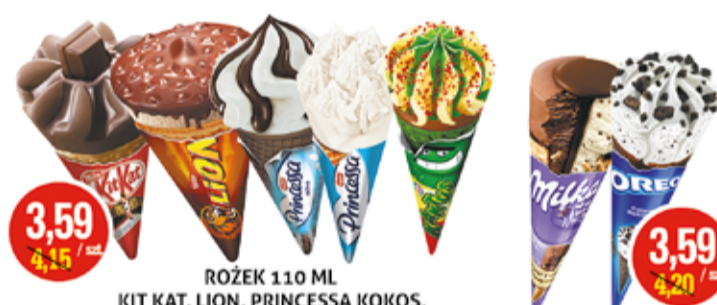
ROŻEK 110 ML KIT KAT, LION, PRINCESSA KOKOS, PRINCESSA ZEBRA, KAKTUS NESTLE (CENA ZA 1 L - 32,64 ZŁ)