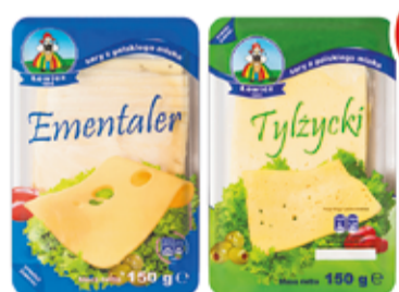
SER ŻÓŁTY PLASTY 150 G ASORTYMENT OSM ŁOWICZ (CENA ZA 1 KG - 23,67 ZŁ)