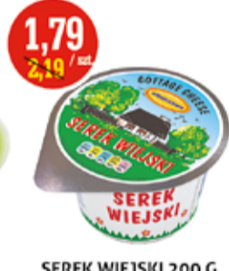
SEREK WIEJSKI 200 G WŁOSZCZOWA (CENA ZA 1 KG - 8,95 ZŁ)