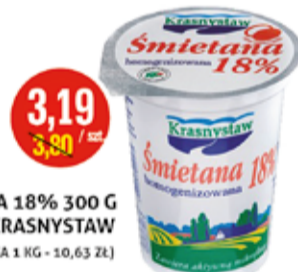
ŚMIETANA 18% 300 G KRASNYSTAW (CENA ZA 1 KG - 10,63 ZŁ)