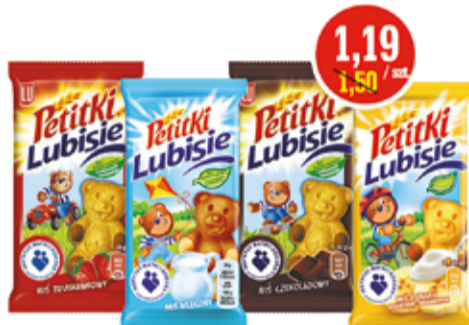
PETITKI LUBISIE 25-30 G (CENA ZA 1 KG - 39,67/47,60 ZŁ)