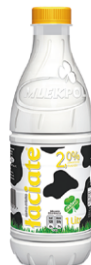
ŁACIE ŚWIEŻE MLEKO 2% 1 L