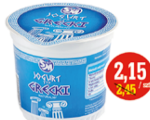
JOGURT GRECKI 350 G OSM SIEDLCE (CENA ZA 1 KG - 6,15 ZŁ)