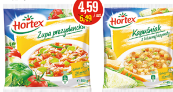
BARSCZ UKRAIŃSKI, KAPUŚNIK, ZUPY: JARZYNOWA, JESIENNO-ZIMOWA, PREZYDENCKA, WIOSENNA 450 G HORTEX (CENA ZA 1 KG - 10,20 ZŁ)

Nowa kolekcja kurtek jesiennie-zimowych, znane polskie marki.