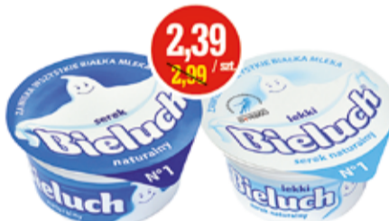
BIELUCH SEREK NATURALNY 150 G (CENA ZA 1 KG - 15,94 ZŁ)