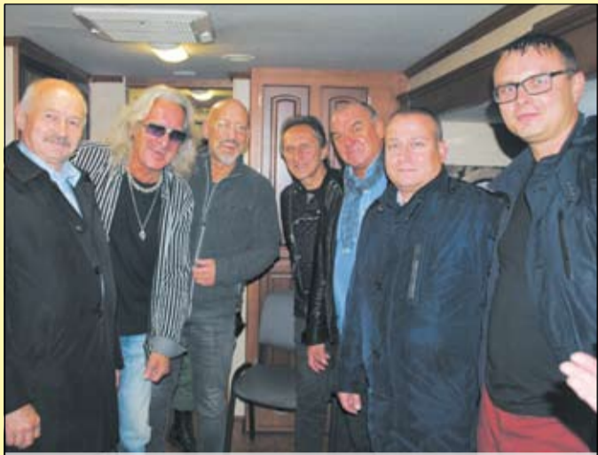
Nowy skład Perfectu?

„Kolej na Wawer” – pod takim hasłem odbył się w dzielnicy duży festyn. Osiedla prezentowały dorobek, a w finale zagrał Perfect, legenda rocka.