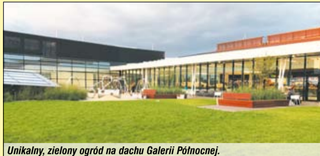
Unikalny, zielony ogród na dachu Galerii Północnej.

14 września na Białołęce została otwarta Galeria Północna – olbrzymie centrum handlowe. Nie obyło się bez zakorkowania okolicznych ulic.