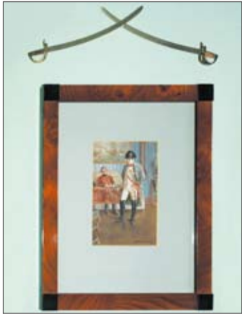
Napoleon Bonaparte, mój ulubiony bohater inspirator tej opowieści, na portrecie wiszącym w moim domu.