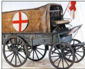
Wóz sanitarny, chciałoby się rzec „sanitarka” doby napoleońskiej (1810).

Tu wreszcie dochodzę do sedna tej historii. Wykapani, sięgam w końcu po ową czarną kostkę, która okazuje się być czarną, siatkową koszulą operacyjną. Nie musi być ona na miarę i nie to mnie bulwersuje w tej historii, ale owa głęboka, żalobna czerń! Wszystko da się wytłumaczyć, ale nie to, że szpital wyposaża pacjenta w czarną żalobną szatę na drogę do sali ope-