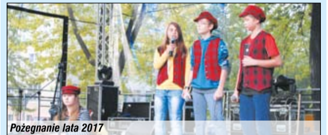
Pożegnanie lata 2017