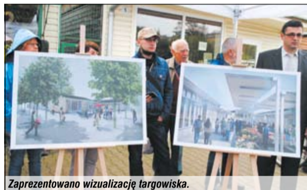
Zaprezentowano wizualizację targowiska.