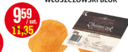
CEKO SER WĘDZONY ZBÓJNICZEK ONDRASZEK 300 G (CENA ZA 1 KG - 31,96 ZŁ)