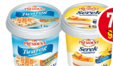
PRESIDENT TWARÓG SERNIKOWY NATURALNY, WANILIOWY 1 KG