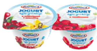
PIĄTNICA JOGURT GRECKI OWOCOWY 150 G ASORTYMENT (CENA ZA 1 KG - 11,93 ZŁ)