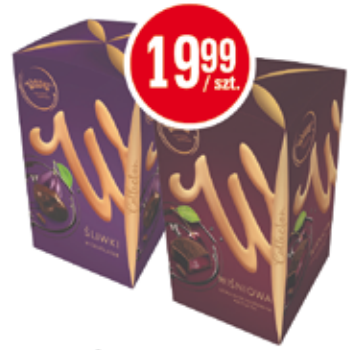
WAWEL ŚLIWKA W CZEKOLADZIE, CZEKOLADKA WIŚNIOWA 300 G (CENA ZA 1 KG - 66,63 ZŁ)