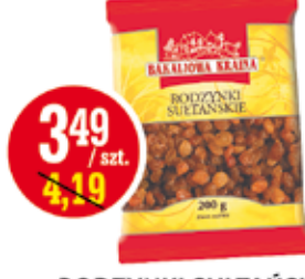
RODZYNKI SUŁTAŃSKIE 200 G KART-PAK (CENA ZA 1 KG - 17,45 ZŁ)