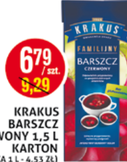
KRAKUS BARSZCZ CZERWONY 1,5 L KARTON (CENA ZA 1 L - 4,53 ZŁ)