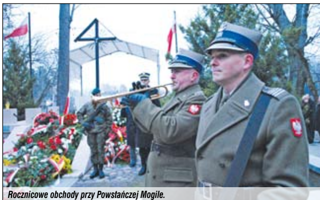
Rocznicowe obchody przy Powstańczej Mogile.

– Oddajmy hold i wspomnijmy nie tylko podchorążych, którzy w nocy z 29 na 30 listopada wznieśli Powstanie Listopa-