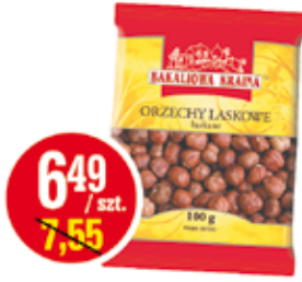
ORZECHY LASKOWE 100 G KART-PAK (CENA ZA 1 KG - 64,90 ZŁ)