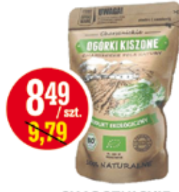
CHARSZNICKIE OGÓRKI KISZONE 500 G BIO (CENA ZA 1 KG - 16,99 ZŁ)