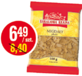
MIGDAŁY PŁATKI 100 G KART-PAK (CENA ZA 1 KG - 64,90 ZŁ)