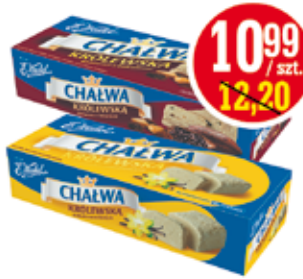
WEDEL CHALWA 250 G (CENA ZA 1 KG - 43,96 ZŁ)