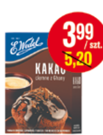
WEDEL KAKAO 80 G (CENA ZA 1 KG - 49,88 ZŁ)