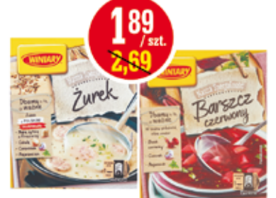
WINIARY BARSZCZ BIAŁY, ŻUREK, ŻUREK Z GRZYBAMI, BARSZCZ CZERWONY, ZUPA GRZYBOWA 48-66 G (CENA ZA 1 KG - 39,37-28,64 ZŁ)