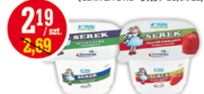
ROLMLECZ SEREK HOMOGENIZOWANY 200 G ASORTYMENT (CENA ZA 1 KG - 10,95 ZŁ)