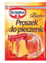
DR. OETKER PROSZEK DO PIECZENIA 30 G (CENA ZA 1 KG - 19,69 ZŁ)