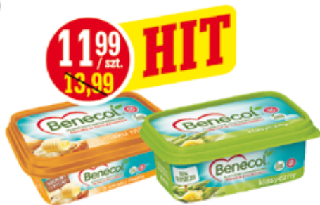
RAISIO MARGARYNA BENECOL 225 G ASORTYMENT (CENA ZA 1 KG - 53,28 ZŁ)