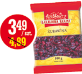
ŻURAWINA SUSZONA 100 G KART-PAK (CENA ZA 1 KG - 34,90 ZŁ)