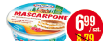
PIĄTNICA MASCARPONE 250 G (CENA ZA 1 KG - 27,96 ZŁ)