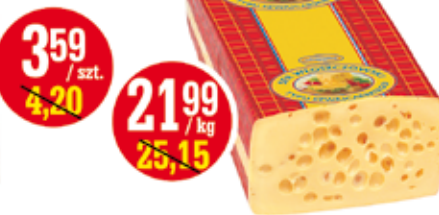
SER ŻÓŁTY EMENTALER WŁOSZCZOWSKI BLOK