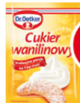
DR. OETKER CUKIER WANILINOWY 16 G (CENA ZA 1 KG - 36,89 ZŁ)