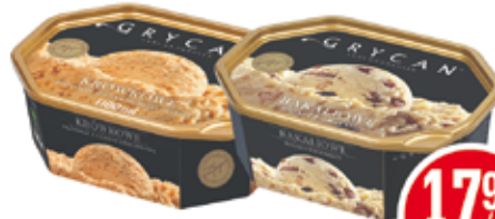
GRYCAN LODY FAMILIJNE PREMIUM 900-1100 ML ASORTYMENT (CENA ZA 1 L - 16,35-19,98 ZŁ)