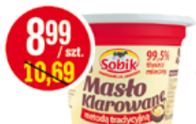
SOBIK MASŁO KLAROWANE 200 G (CENA ZA 1 KG - 44,95 ZŁ)