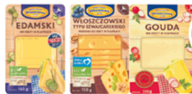
WŁOSZCZOWA SER ŻÓŁTY PŁASTRY 150 G ASORTYMENT (CENA ZA 1 KG - 23,93 ZŁ)