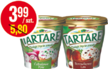
TARTARE SEREK TWAROGOWY 150 G ASORTYMENT (CENA ZA 1 KG - 26,60 ZŁ)