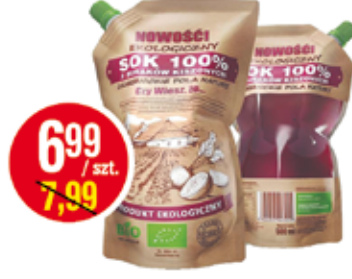
CHARSZNICKIE SÓK Z BURAKA KISZONEGO 100% 500 ML BIO (CENA ZA 1 L - 13,98 ZŁ)