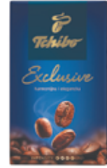
KAWA TCHIBO EXCLUSIVE 250 G MIELONA (CENA ZA 1 KG - 43,96 ZŁ)