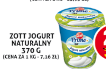
ZOTT JOGURT NATURALNY 370 G (CENA ZA 1 KG - 7,16 ZŁ)