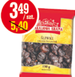
ŚLIWKI KALIFORNIJSKIE 150 G KART-PAK (CENA ZA 1 KG - 23,27 ZŁ)