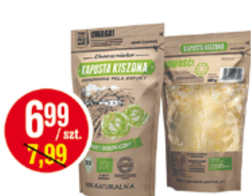
CHARSZNICKIE KAPUSTA KISZONA 750 G BIO (CENA ZA 1 KG - 9,32 ZŁ)