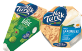
TUREK SER PLEŚNIOWY BRIE 125 G, CAMEMBERT 120 G (CENA ZA 1 KG - 42,00-43,75 ZŁ)