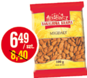
MIGDAŁY KALIFORNIJSKIE 100 G KART-PAK (CENA ZA 1 KG - 64,90 ZŁ)