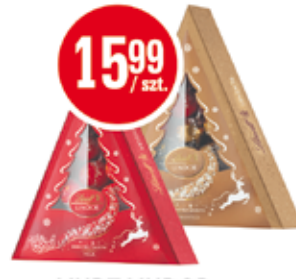
LINDT LINDOR XMASS TREE 125 G (MILK, ASSORTED, SILVER) (CENA ZA 1 KG - 127,92 ZŁ)