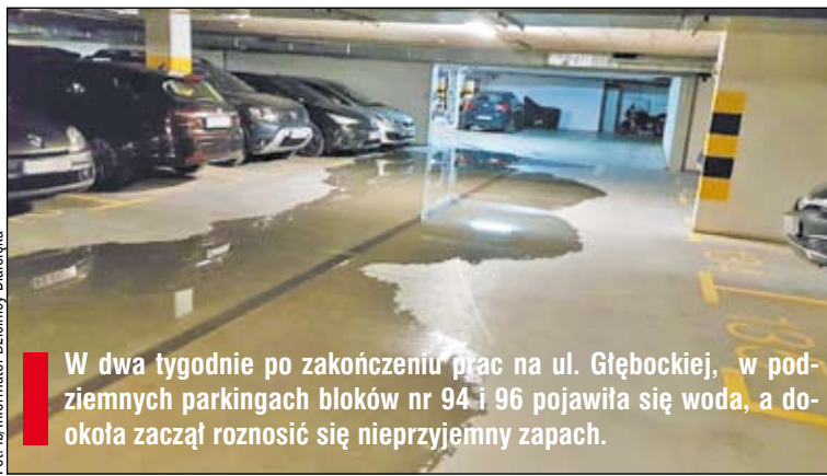
W dwa tygodnie po zakończeniu prac na ul. Głębockiej, w podziemnych parkingach bloków nr 94 i 96 pojawiła się woda, a dookoła zaczął roznosić się nieprzyjemny zapach.