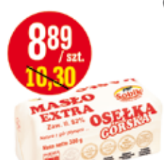
SOBIK MASŁO OSEŁKA GÓRSKA 300 G (CENA ZA 1 KG - 29,63 ZŁ)