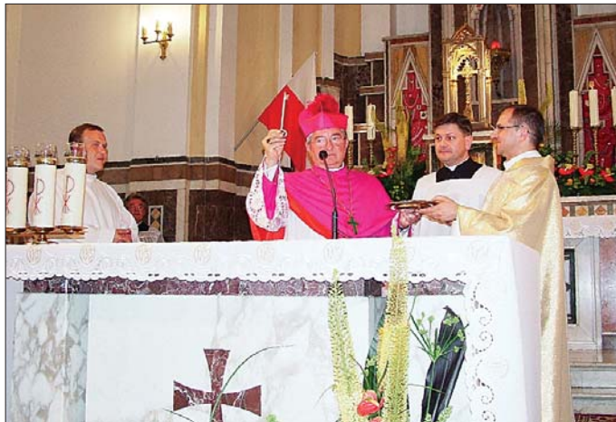
Symboliczne przekazanie klucza do świątyni

Po części oficjalnej goście zostali zaproszeni do cieniastych ogrodów parafialnych, w których zorganizowany został poczęstunek. O godz. 21.00 serdeczne rozmowy na moment zostały prze-