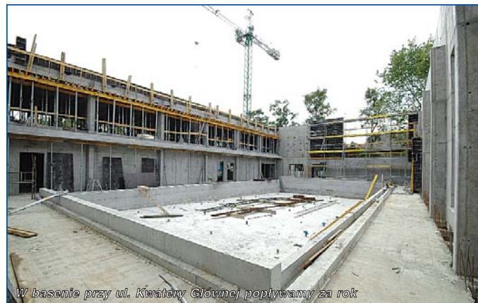
W basenie przy ul. Kwatery Głównej popływamy za rok

Wszyscy najbardziej niecierpliwie czekają chyba jednak na ukończenie największej inwestycji sportowej, a mianowicie basenu przy Szkole Podstawowej nr 215 na ulicy Kwatery Głównej 13. Dotychczas był tam stary basen z lat 60-tych. Od dawna nie spełniał on jednak podstawowych norm sanitarnych ani bezpieczeństwa. W miejscu starego basenu zostaną zabudowane dwie nowoczesne niecki. Jedna,