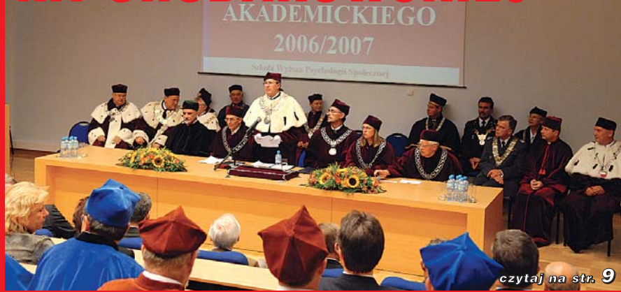
czytaj na str. 9