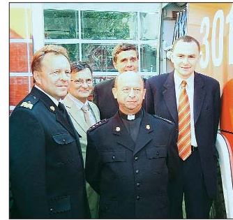
Darczyńcy i darczyńcy.