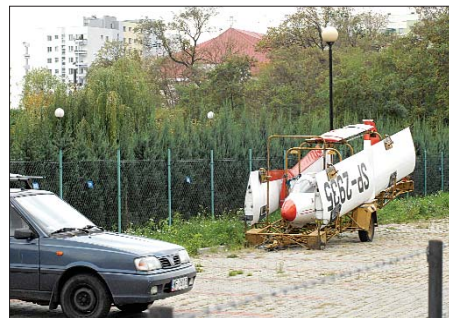
Lotnisko na Gocławiu-Lotnisko? Nie – to tylko samotna awionetka chwilowo zaparkowała na parkingu przy ul. Bohaterewicza.