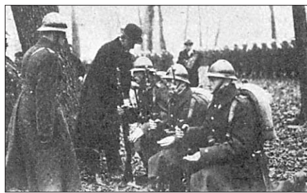
Prezydent RP - Stanisław Wojciechowski - dokonuje promocji Podchorążych. Fot. ze zbiorów Tadeusza Wł. Świątko (1925).

wiciele wybrani przez mieszkańców Warszawy, ale ludzie wyznaczeni do różnych czynności według swoich umiejętności. Oddani sprawie, gwarantowali sumienne wypełnienie wyznaczonych im obowiązków.