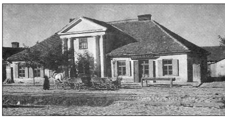
Karczma w Wierzbnie, w której według legendy miał się zatrzymać w. Ks. Konstanty.

Jak głoszą przekazy, wybuch powstania poprzedził napad na Pałac Belwederski, będący wówczas rezydencją wielkiego księcia Konstantego, głównodowodzącego armii polskiej, brata cara. Według legendy, wielki książę w przebraniu niewieścim miał ponoć uciec z pałacu w towarzystwie swej małżonki, Polki, Joanny Grudzińskiej, obdarzonej tytułem Księżnej Łowickiej. W słotną i chłodną noc - z 29 na 30 listopada - karetą wioząca rosyjskiego satrapę, zienawidzonego przez żołnierzy za ich poniżanie, przemknął między mokotowskimi rogatkami, w asyście kilku żołnierzy i oficerów rosyjskich, dojechała do karczmy w Wierzbnie. Tam książę zatrzy-