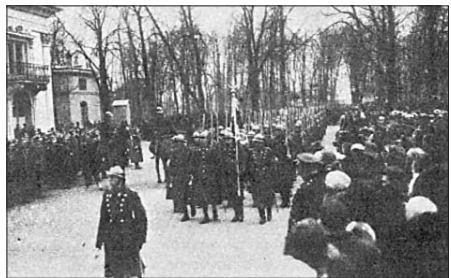
Defilada Szkoły Podchorążych w Łazienkach z okazji obchodów 95-tej rocznicy Powstania Listopadowego. Fot. ze zbiorów Tadeusza Wł. Świątko (1925).