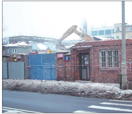
... i w trakcie rozbiórki.

Według podejrzeń okolicz- nych mieszkańców „inwesto- rem jest świeżo upieczony bi- znesmen przybyły ze Stanów Zjednoczonych, a więc ktoś nie