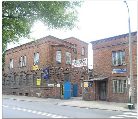
Stan przed rozbiórką...