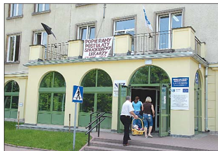
Poparcie dla strajkujących wyrazili lekarze ze Szpitala Dziecięcego przy ul. Niekańskiej.

Środki na podwyżki powinny - zdaniem Platformy - pochodzić m.in. ze wzrostu