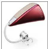
Oticon Delta - aparat XXI wieku

W związku z trwającą promocją pracownicy gabinetu audioprotetycznego firmy Fonikon zapraszają wszystkich zainteresowanych na bezpłatne badanie słuchu oraz konsultację audioprotetyczną. Istnieje możliwość skorzystania z refundacji NFZ i środków PFRON. Gabinet mieści się przy ulicy Br. Czecha 39 (w pobliżu stacji Warszawa-Wawer), tel. 353-42-50. Godziny otwarcia: codziennie od 10.00 do 17.30. AS 2007