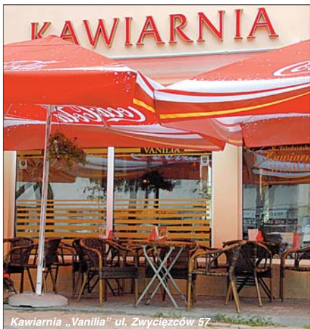
Kawiarnia „Vanilia” ul. Zwycięzców 57