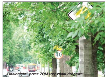
„Odsłonięte” przez ZOM trzy znaki drogowe...

znaki zostały odsłonięte. Po tygodniu straciliśmy nadzieję. Dopiero po półtora tygodnia ZOM przetrzebił listowie przed znakami przy ul. Saskiej. Patrząc na zdjęcie tego miejsca