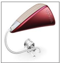
Oticon Delta - aparat XXI wieku

W związku z trwającą promocją pracownicy gabinetów partnerskich firmy Oticon zapraszają wszystkich zainteresowanych na bezpłatne badanie słuchu oraz konsultację audioprotetyczną. Istnieje możliwość skorzystania z refundacji NFZ i środków PFRON. W związku z dużym zainteresowaniem naszymi usługami prosimy o telefoniczną rezerwację wizyt.