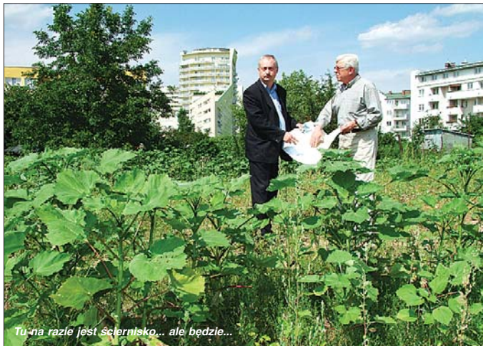
Tu na razie jest ścierzynisko... ale będzie...

wa o gruntach wzdłuż ul. Jana Nowaka Jeziorańskiego oraz przy jeziorze Gocławskim – przyp. ar). W spotkaniu u prezydenta Millera nie uczestniczyli inwestorzy. Na razie chce-