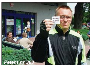
Patent nr 388