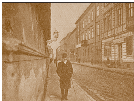
Spacerkiem po Warszawie. (ok. 1914 r.)