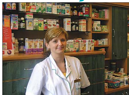
Miła i profesjonalna obsługa to jeden z wielu atutów apteki ARALIA

PRZYJEMNIE – standardem obecnym w aptekach ARALIA jest także zadbanie o to, aby