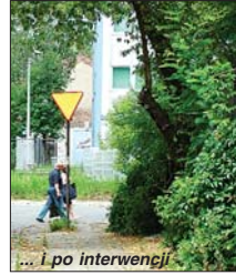
... i po interwencji

pieczeństwa akcja ZOM-u to chwalebna sprawa. Nie można jednak doprowadzić do tego, żeby zgłaszający odnosili wrażenie, że są lekceważeni. Już niedługo liście z drzew zaczynają opadać i nie będzie tak dobrze widać, które znaki są niewidoczne. Namawiamy więc Cytelników, szczególnie tych zmo-