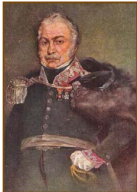
Gen. Józef Dwernicki

30 listopada Rada Administracyjna powołała Straż Bezpieczeństwa, dowodzoną przez Piotra Łubieńskiego, której zadaniem było rozbrojenie ludności cywilnej Warszawy. Po nieudanych próbach rozbrojenia powstańców nastąpiła eskalacja ruchu powstańczego. 1 grudnia powstało Towarzystwo Patriotyczne, kierowane przez Maurycego Mochnackiego. Domagało się podjęcia natychmiastowej akcji zbrojnej przeciwko wojskom rosyjskim.