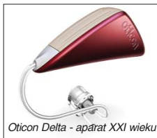
Oticon Delta - aparat XXI wieku

Jedynym w swoim rodzaju trójkątnym kształt wzmacniacza aparatu Delta zapewnia optymalne położenie systemu nowoczesnych mikrofonów kierunkowych w płaszczyźnie po-