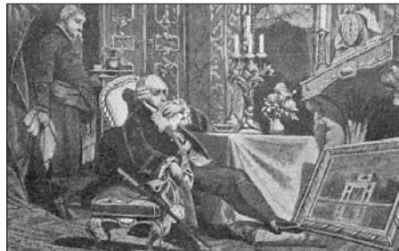
Stanisław August Poniatowski.

Ostatni polski monarcha miał pięcioro rodzeństwa, trzech braci i dwie siostry. Pierwszy to Kazimierz, podkomorz, przeciwnik reform, założyciel ogrodów na skarpie, po obu stronach ul. Książ-