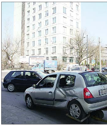
Jedna z niedawnych kolizji u zbiegu Mińskiej i Chodakowskiej.