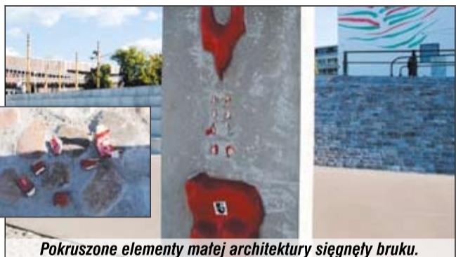
Pokruszone elementy małej architektury sięgnęły bruku.