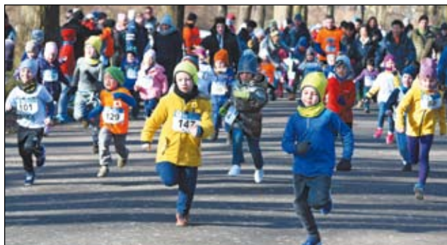
Swoją trasę miały również dzieci, które musiały pokonać dystans 250 m.