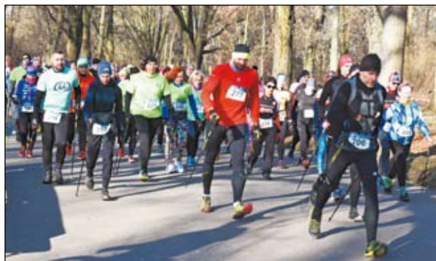
Coraz popularniejszą dyscypliną jest Nordic Walking.