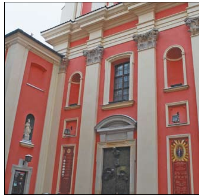
Kościół Jezuitów na Świętojańskiej – Sanktuarium Matki Bożej Łaskawej patronki Warszawy. Z lewej strony widoczna kamienna figura patronki stolicy.

Udział pijarów w powstaniu kościuszkowskim w roku 1794 spowodował, że po upadku Warszawy generał Suworow zajął sanktuarium na połowę cerkiew prawosławną. Zaborcy zakazali tradycyjnych procesji majowych, jak również działalności bractwa. W zamian za utracony Kościół władze carskie przekazały pijarom w roku 1834