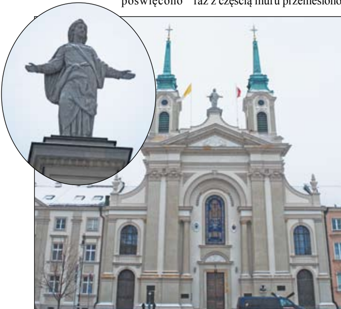
Kościół przy ul. Długiej. Pierwotnie należał do Pijarów i to tu był obraz Matki Bożej Łaskawej. Na zwieńczeniu widać figurę Matki Boskiej z podobnym układem rąk jak w obrazie.