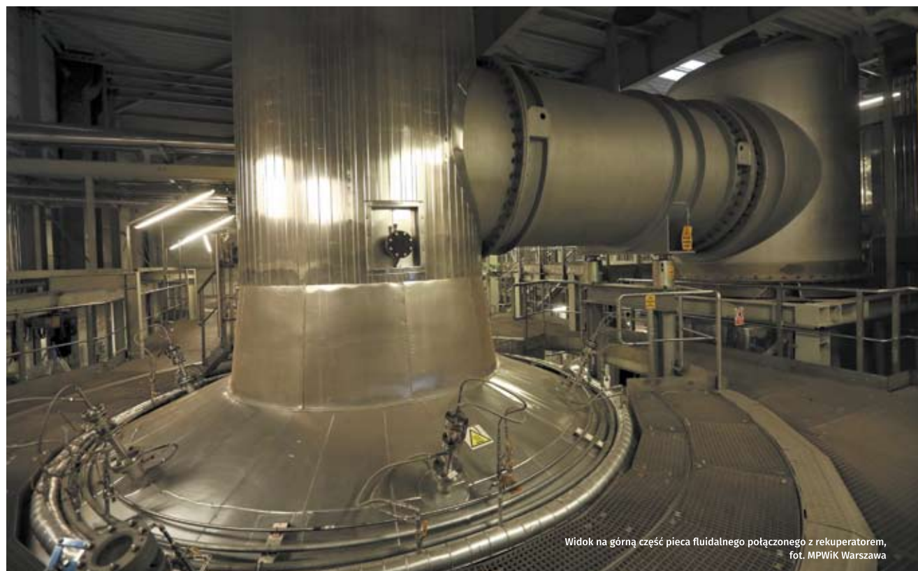
Widok na górną część pieca fluidalnego połączonego z rekuperatorem

Finalnie wszystkie prace wykonawca powinien zakończyć w III kwartale 2021 r.