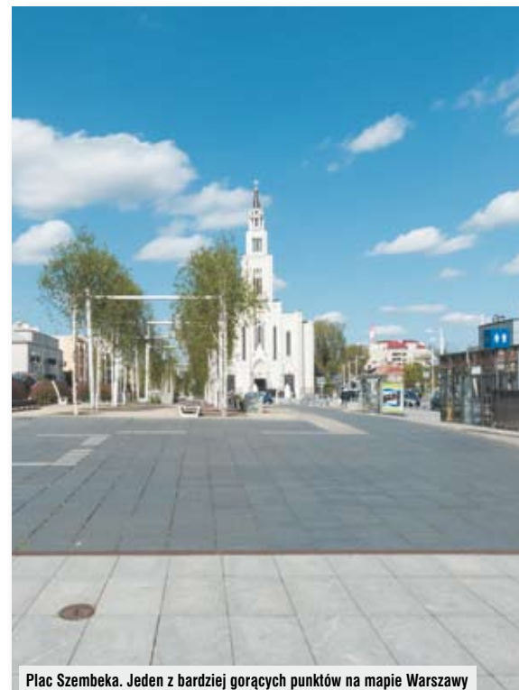
Plac Szembeka. Jeden z bardziej gorących punktów na mapie Warszawy