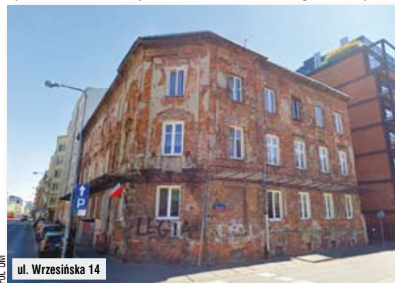
ul. Wrzesińska 14

MATERIAŁ INFORMACYJNO-PRASOWY URZĘDU DZIELNICY PRAGA-POŁUDNIE