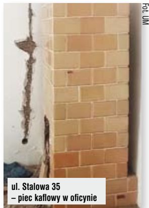
ul. Stalowa 35 – piec kaflowy w oficynie

W 20 budynkach prace już trwają. Są one na różnym etapie przygotowywania. Cztery z nich posiadają pozwolenia na budowę.