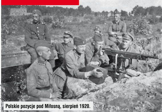
Polskie pozycje pod Miłosną, sierpień 1920.