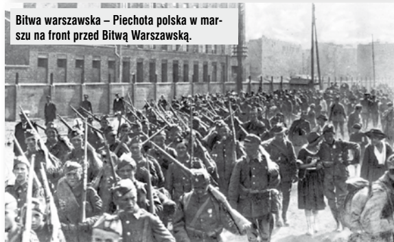
Bitwa warszawska – Piechota polska w marszu na front przed Bitwą Warszawską.

niesiono na miejsce, w którym stoi do chwili obecnej. Jest też pamiątka „Bitwy Warszawskiej” w letniej rezydencji papieża w Castel Gandolfo. Otóż na ścianie kaplicy, znajduje się potężnych rozmiarów obraz bitwy pod Ossowem, pędzla wybitnego polskiego malarza batalisty Jana Rozena, wykonany na polecenie papieża Piusa XI, który w 1920 roku był nuncjuszem w Warszawie.