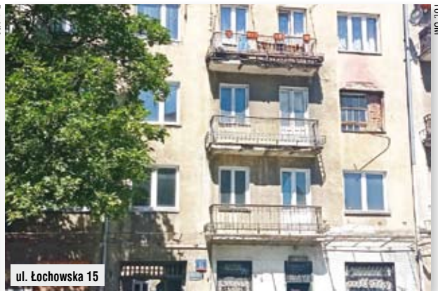
ul. Łochowska 15

Nowy wygląd, jako pierwsze, doroku 2028, zyskają m.in. kamienice przy Stalowej 35 (oficyna), Łochowskiej 15, Ząbkowskiej 19 (2 oficyny), Małej 5, Stalowej 34 i 54,