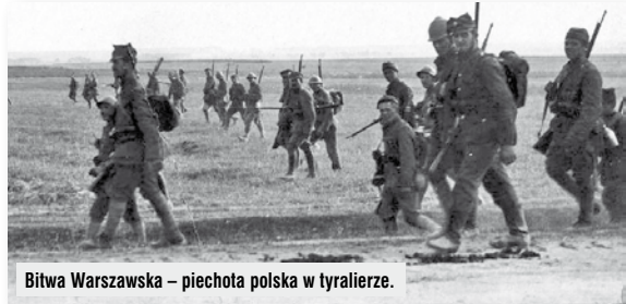
Bitwa Warszawska – piechota polska w tyralierze.

Szczątki poległych w obronie stolicy złożone zostały w wydzielonej kwaterze na Cmentarzu Wojskowym. W głównej alei tej nekropolii ustawiono pomnik Warszawskich Orłów dłuta Stanisława Jackowskiego. Na umieszczonej z lewej strony płaskorzeźbie artysta utrwalił postać księdza Skorupki. Wówczas też jedną z ulic Śródmieścia – Sadową (boczna od ul. Marszałkowskiej), przemianowano na ul. ks. Skorupki. W okresie PRL-u powrócono do pierwotnej nazwy ulicy, a pomnik na Cmentarzu Wojskowym, przemianowanym na Cmentarz Komunalny prze-