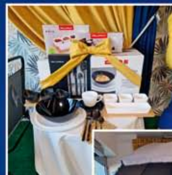
6-OSOBY ZESTAW KAWOWY "STOLICZKU NAKRYJ SIĘ"

OPRAWA MUZYCZNA - SZKOŁA MUZYCZNA IRINY JÓZEFOWICZ - WYSTĘPY KADRY I ABSOLWENTÓW