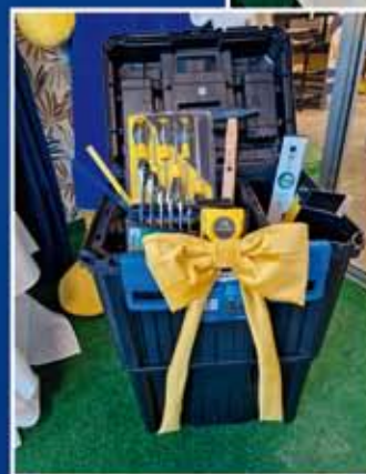
ZESTAW NARZĘDZIOWY W SKRZYŃCE NA KÓŁKACH "ZRÓB TO SAM"