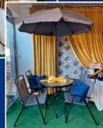
ZESTAW MEBLI OGRODOWYCH "CZAS NA RELAKS"