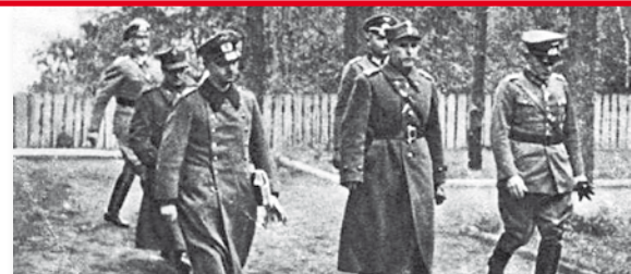
Gen. Tadeusz Kutrzeba i gen. Johannes Blaskowitz (z prawej) udają się na rozmowy w sprawie kapitulacji Warszawy. 27 września 1939 r.

26 września 1939 r., czyli w 25 dniu obrony stolicy