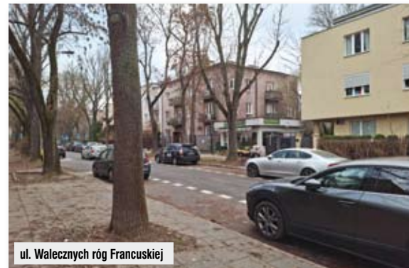
ul. Walecznych róg Francuskiej

Kilka lat temu drogowcy szacowali liczbę aut wjeżdżających spoza Warszawy na pół miliona dziennie. Zarejestrowanych samochodów w stolicy pod koniec ubiegłego roku było 2 129 318 – to o 267 343 więcej niż mieszkańców. Problemem może