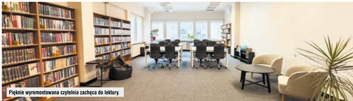
Pięknie wyremontowana czytelnia zachęca do lektury.

– Ma Pani swój udział w szeroko zakrojonych pracach związanych z regulacją spraw gruntowych. Chodzi o tereny, na których zostały