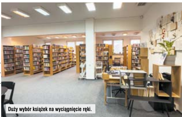
Duży wybór książek na wyciągnięcie ręki.

– Dziękuję za rozmowę. Rozmawiał Andrzej Skoczylas (AS)