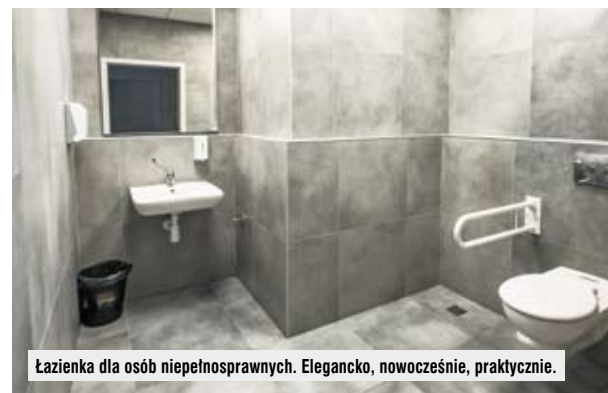
Łazienka dla osób niepełnosprawnych. Elegancko, nowoczesnie, praktycznie.