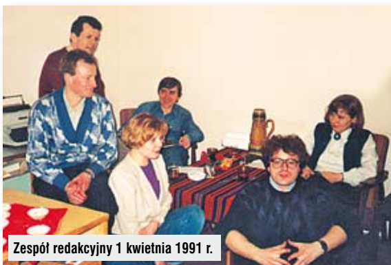
Zespół redakcyjny 1 kwietnia 1991 r.