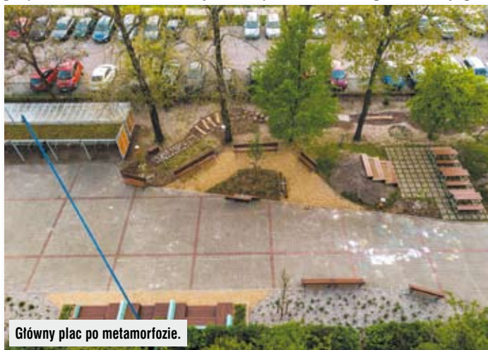
Główny plac po metamorfozie.

Materiał został opracowany w ramach projektu „Szkoła przyjazna klimatowi. Modelowe centrum edukacji i adaptacji do zmian klimatu w mieście” dofinansowanego przez Islandię, Liechtenstein i Norwegię w ramach funduszy EOG, w ramach Programu Środowisko, Energia i Zmiany Klimatu; obszar programowy: Klimat. Za treść artykułu odpowiada wyłącznie Fundacja Sendzimira.