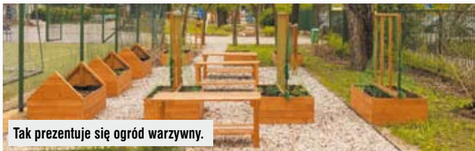
Tak prezentuje się ogród warzywny.