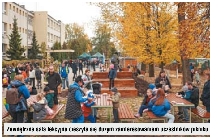
Zewnętrzna sala lekcyjna cieszyła się dużym zainteresowaniem uczestników pikniku.

Dla mnie osobiście bardzo ważne było włączenie w proces całej spo-