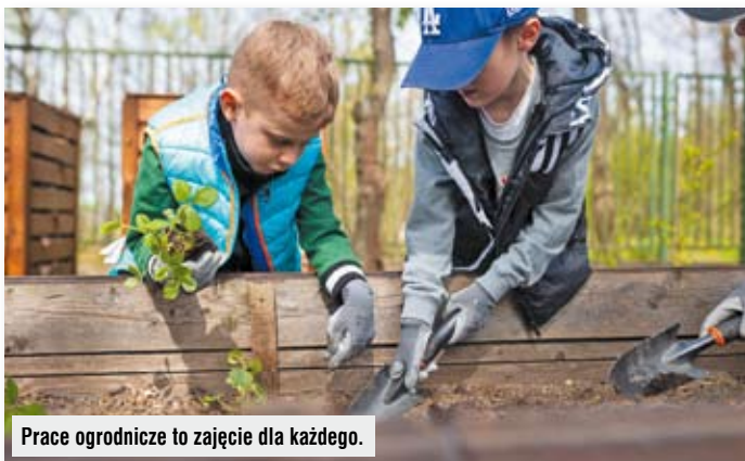
Prace ogrodnicze to zajęcie dla każdego.