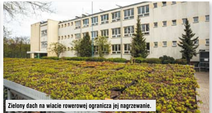
Zielony dach na wiacie rowerowej ogranicza jej nagrzewanie.