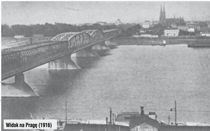
Widok na Pragę (1916)

Jak cała Warszawa, tak i Praga nie była jednolita wyznaniowo, o czym dzisiaj zdajemy się nie pamiętać. Na ruchliwych tutejszych ulicach słyszało się nie tylko język polski, ale również rzadko obecnie używany język jidisz, którym posługiwała się ludność pochodzenia żydowskiego.