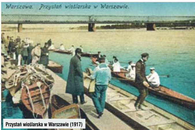
Przystań wioślarska w Warszawie (1917)

a nawet Kamionkowską. Wzdłuż niej, szczególnie w tych okazałszych, murowanych kamienicach, zamieszkiwała inteligencja, na którą składali się adwokaci, lekarze i kupcy, prowadzący w okolicy swe interesy.