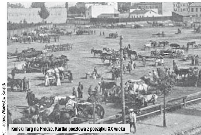
Koński Targ na Pradze. Kartka pocztowa z początku XX wieku