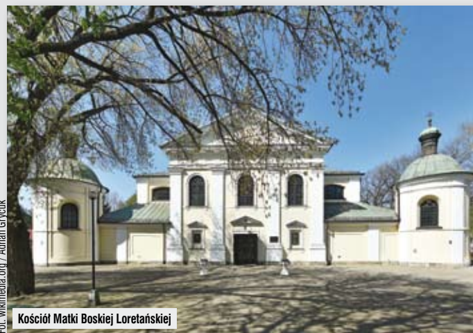
Kościół Matki Boskiej Loretańskiej

Ze wspomnianymi częściami Pragi łączyły się Szmulowizna (okolice ul. Radzymińskiej) i Kamionek (rejon Grochowskiej), teren początkowo wybitnie rolniczy, stopniowo przekształcający się w dzielnicę przemysłową.