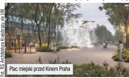
Plac miejski przed Kinem Praha

zawodów rzemieślniczych poprzez wprowadzenie instalacji artystycznej na nowo projektowanym placu przed dawnym Kinem Praha. Natomiast w zakresie ul. Floriańskiej doceniono zachowanie historycznego przebiegu ulicy i zrównoważenie potrzeb postojowych z intensywnym zazielenieniem ulicy.