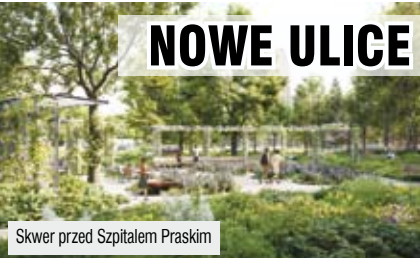
Skwer przed Szpitalem Praskim

Fot. P&amp;S Architektura Krajobrazu via UM