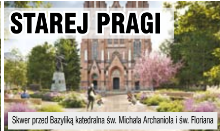
Skwer przed Bazyliką katedralną św. Michała Archanioła i św. Floriana