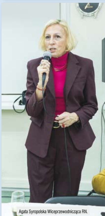
Agata Syropolska Wiceprzewodnicząca RN.