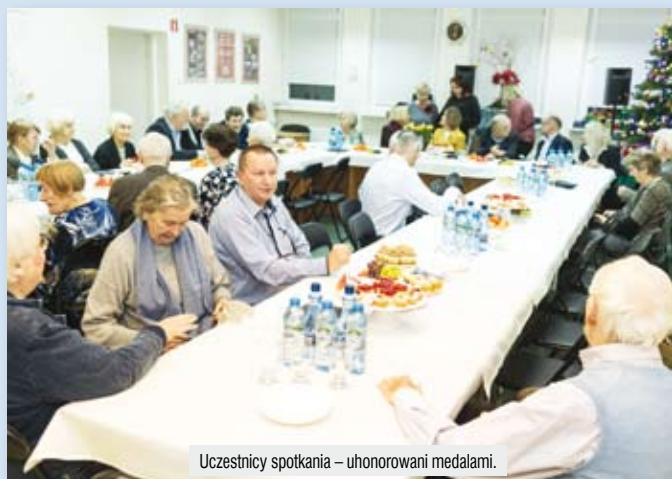
Uczestnicy spotkania – uhonorowani medalami.

Spółdzielnia Mieszkaniowa MIĘDZYNARODOWA