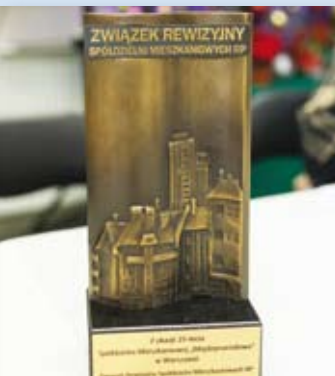
Dedykacja na pucharze: Z okazji 25-lecia Spółdzielni Mieszkaniowej „Międzynarodowa” w Warszawie – Związek Rewizyjny Spółdzielni Mieszkaniowych RP. Styczeń 2025.