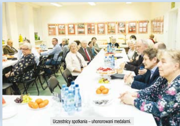
Uczestnicy spotkania – uhonorowani medalami.