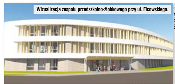
Wizualizacja zespołu przedszkolno-żłobkowego przy ul. Ficowskiego.